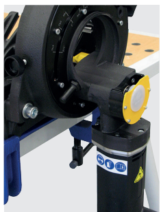
Inklusive zweite Sägeblattaufnahme zum Herausrennen von Rohrbögen