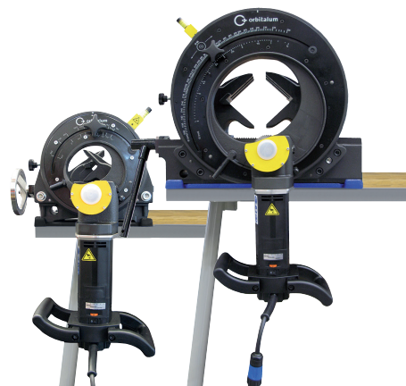
GFX 3.0, GFX 6.6

Die technischen Daten sind unverbindlich. Sie beinhalten keine Zusicherung von Eigenschaften. Änderungen vorbehalten.