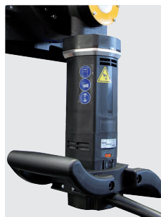
Leistungsstarker Motor mit Überlastschutz und ergonomischen Handgriffen