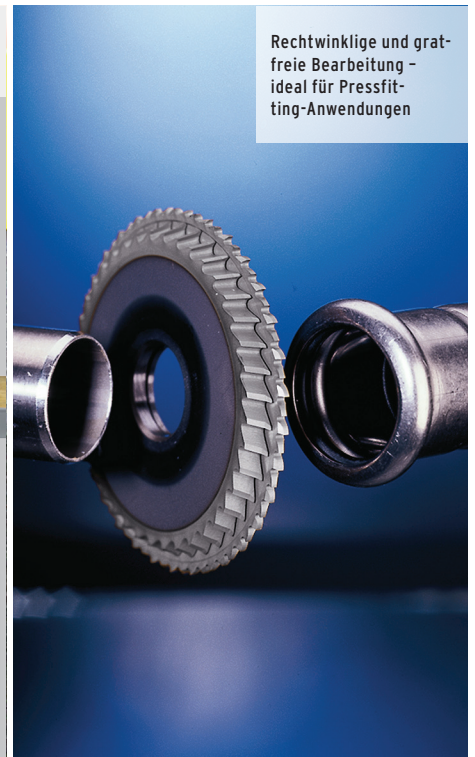
Rechtwinklige und gratfreie Bearbeitung - ideal für Pressfitting-Anwendungen

Unsere GFX-Serie ist ideal zum Trennen dünnwandiger Rohre. Durch die robuste Bauweise für eine lange Lebensdauer sind die Sägen besonders wirtschaftlich; hohe Standzeiten der Werkzeuge steigern außerdem die Produktivität.