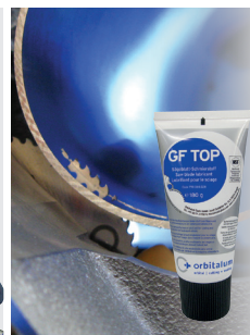
Inklusive Sägeblattschmierstoff GF TOP