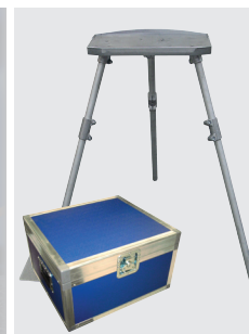
Apparateständer aus Aluminium und hochwertiger, blauer Transportkoffer zu GFX 3.0 optional erhältlich