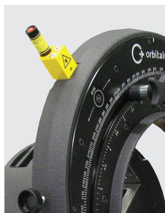
Integrierter Strichlaser zur Trennstellen-Markierung auf dem Rohr